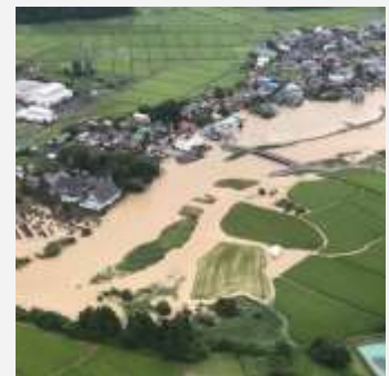
Mưa lớn tháng 7 năm 2023