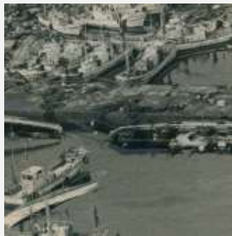
Động đất miền trung Biển Nhật Bản (ngày 26 tháng 5 năm 1983)