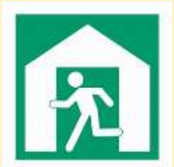
Dấu hiệu của nơi sơ tán tập trung