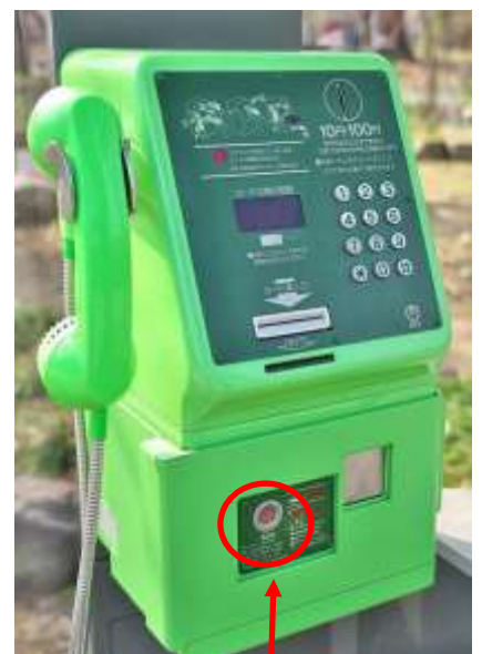
Nút gọi khẩn cấp