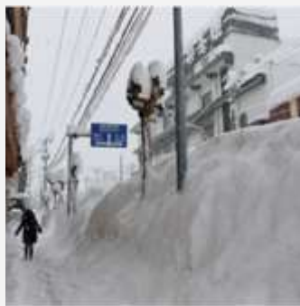
Tuyết lớn tháng 1 năm 2021