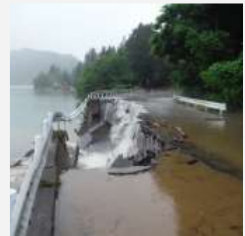
Mưa lớn tháng 7 năm 2017